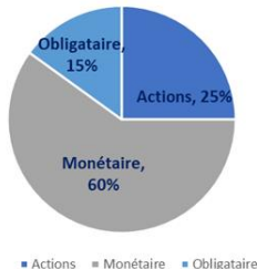
NAOS EQUILIBRÉ PAR CLASSE D'ACTIF